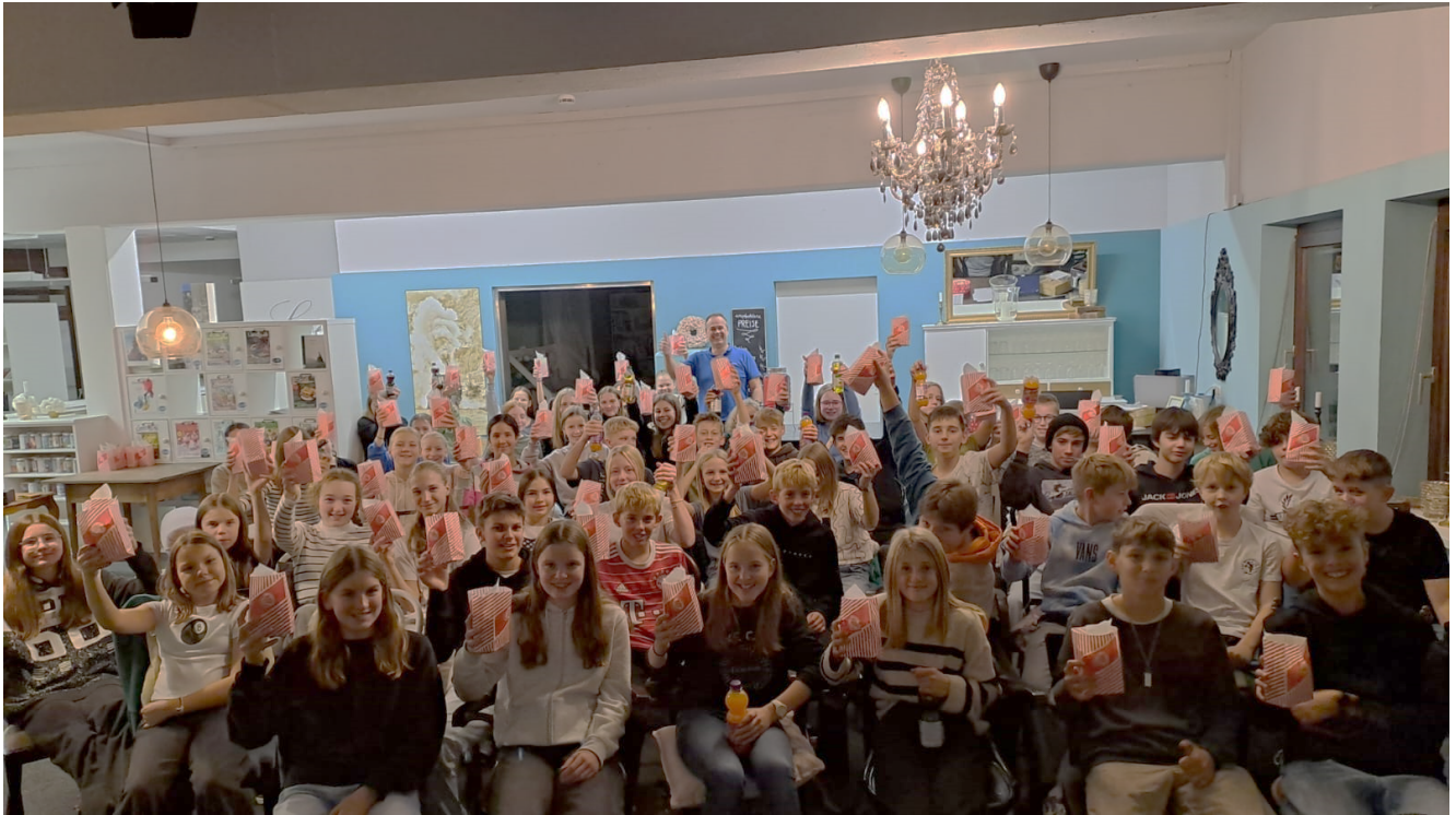
Erstes Treffen beim Kinoabend am 08.11.2024 in „KleinWien“ in Doren

"Das Volk, das im Dunkel lebt, sieht ein helles Licht; über denen, die im Land der Finsternis wohnen, strahlt ein Licht auf."